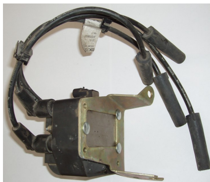
Рис.2. Установка высоковольтного модуля на кронштейн.