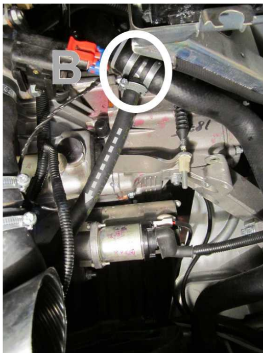
Рис. 5. Прокладка входного рукава.