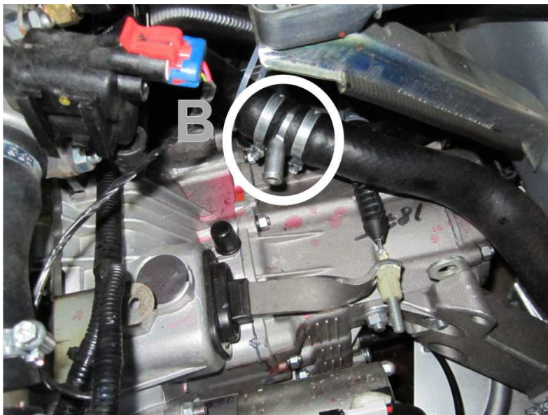
Рис. 4. Врезка тройника входного рукава в нижний шланг радиатора.