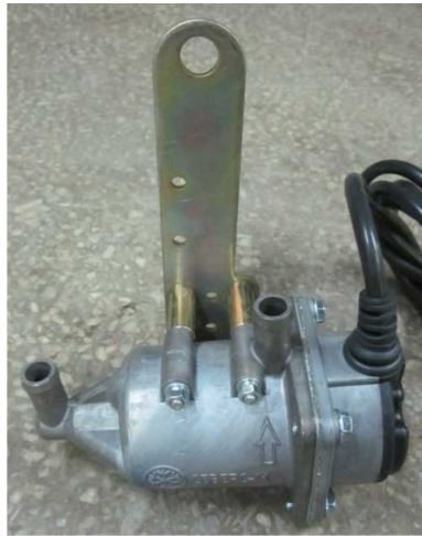
Рисунок 1. Установка кронштейна на подогреватель.