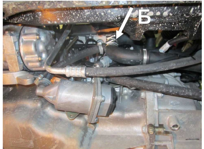
Рисунок 4. Врезка тройника входного рукава. Вид снизу.