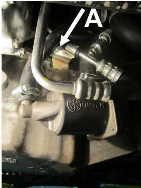
Рисунок 3. Крепление кронштейна. Вид снизу