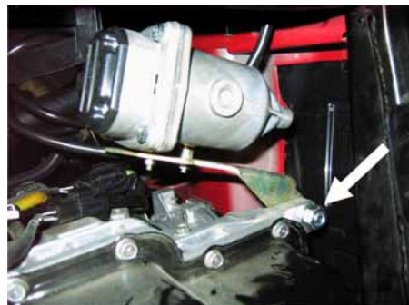
Рисунок 2. Установка подогревателя. Вид снизу.