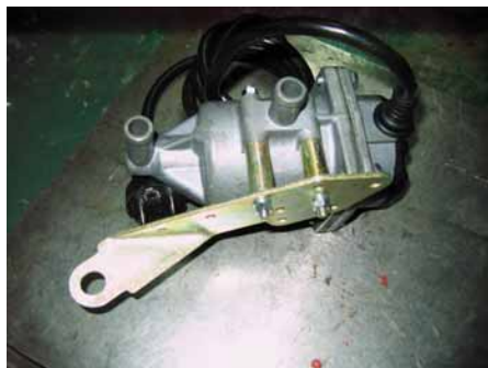
Рисунок 1. Крепление кронштейна.