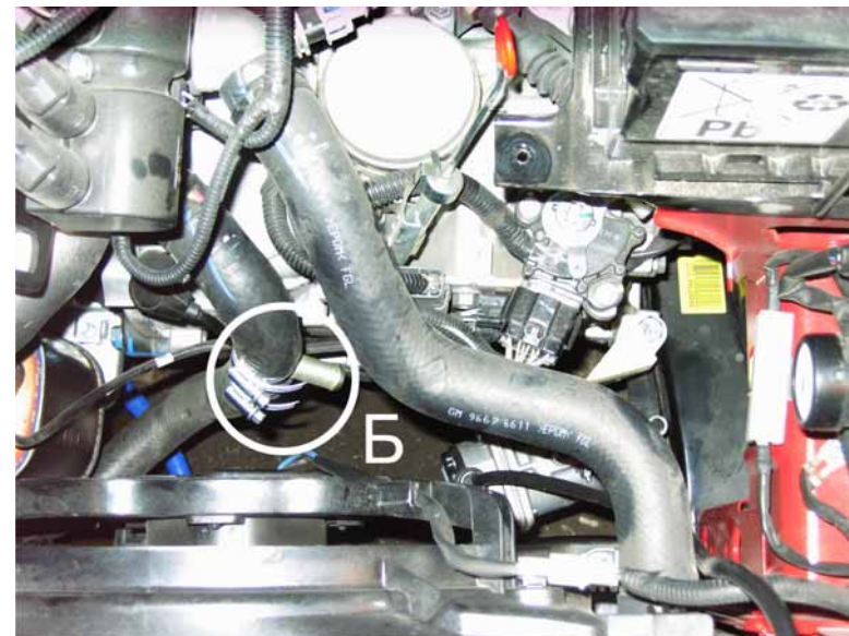
Рисунок 4. Врезка тройника входного рукава.