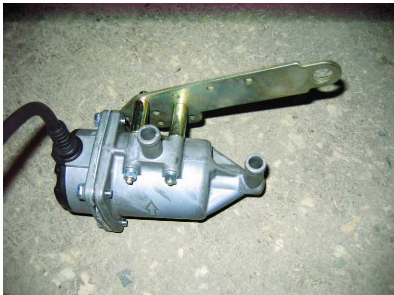
Рисунок 1 Крепление кронштейна