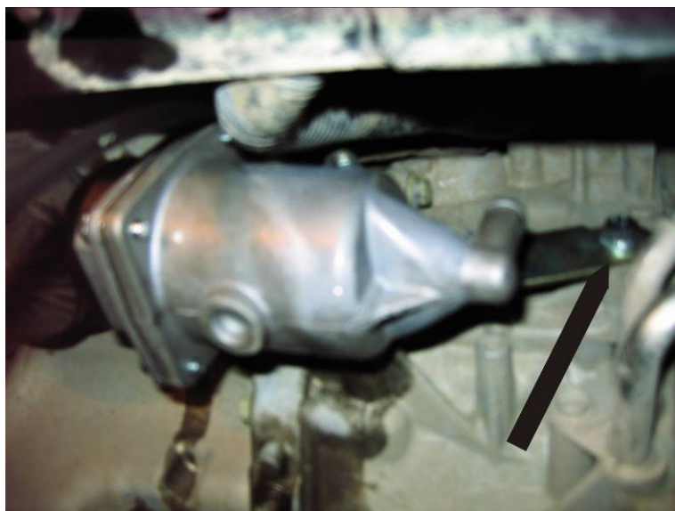
Рисунок 2 Установка подогревателя (Вид снизу)