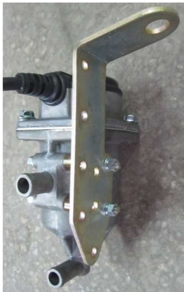
Рисунок 1. Подогреватель на кронштейне