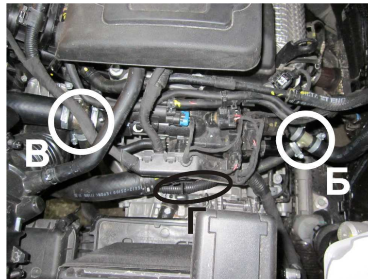
Рисунок 5. Общая картина. Вид сверху.