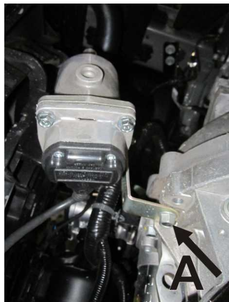
Рисунок 2. Установка на автомобиле. Вид снизу