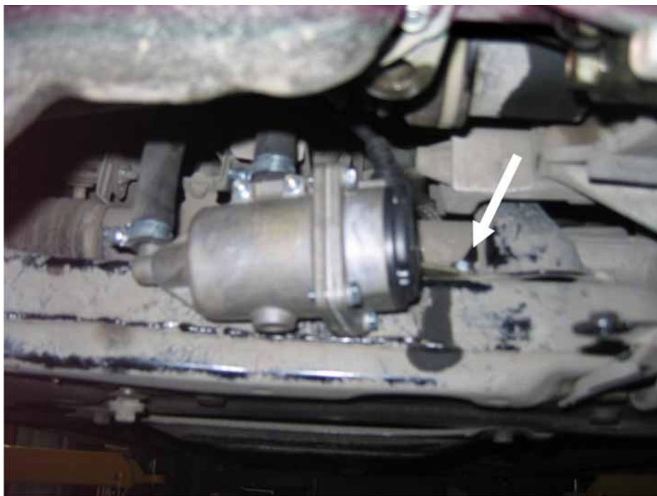
Рисунок 3. Монтаж кронштейна. Вид снизу.