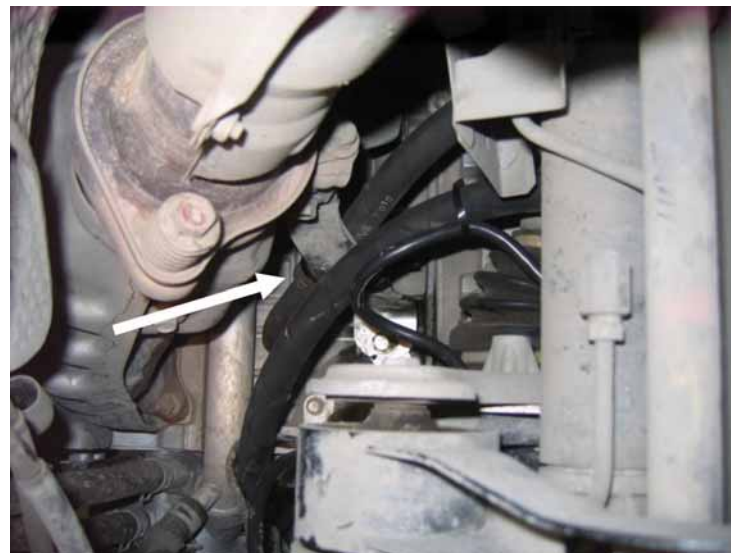
Рисунок 4. Развод рукава. Вид снизу.