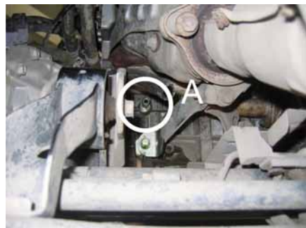
Рисунок 2. Врезка штуцера вид снизу