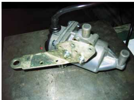
Рисунок 1. Подогреватель на кронштейне