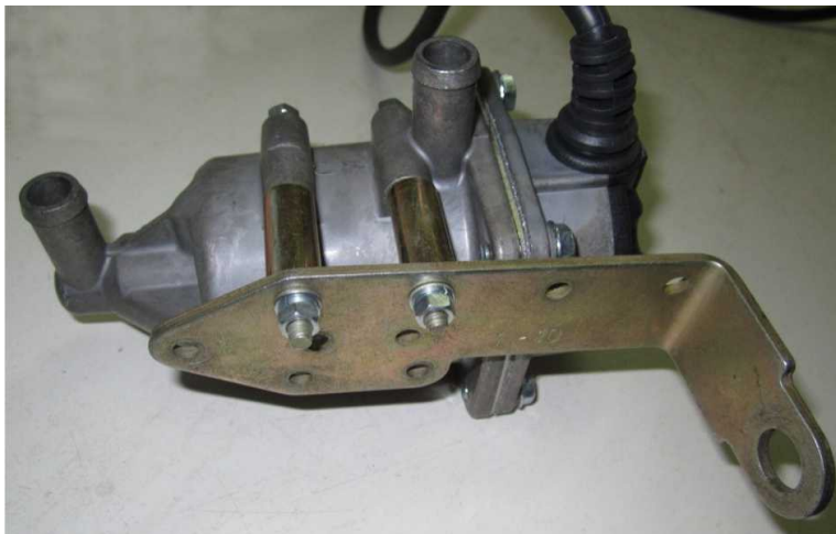
Рисунок 1. Крепление кронштейна на подогреватель.