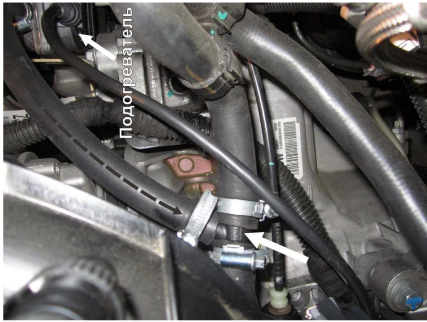
колеса. Вид сверху со стороны левого переднего колеса. Установка тройника выходного рукава.