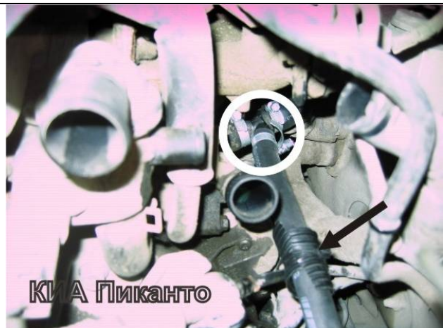
Рисунок 3. Врезка тройника входного рукава. Фиксация рукава