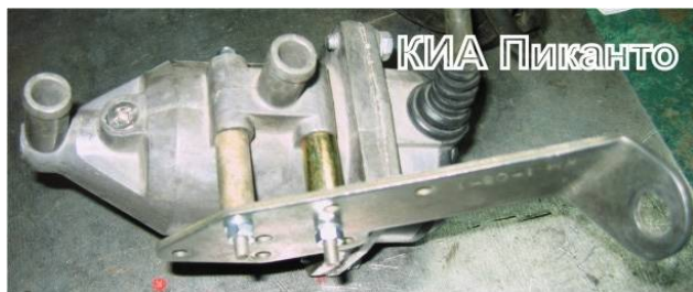
Рисунок 1. Крепление кронштейна на подогревателе.