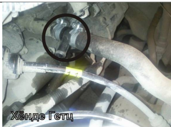
Рисунок 7. Врезка тройника входного рукава.