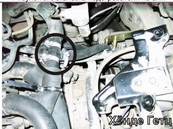
Рисунок 8. Врезка тройника выходного рукава.