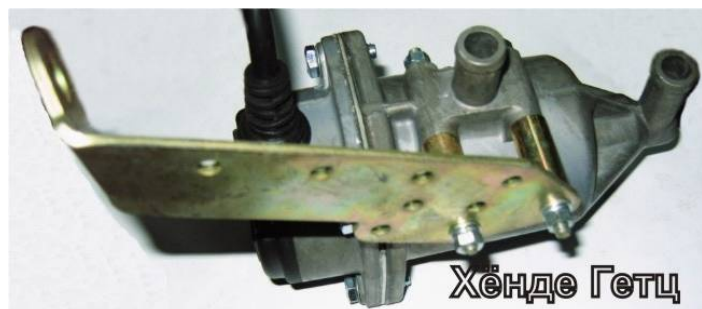
Рисунок 5. Крепление кронштейна на подогревателе.