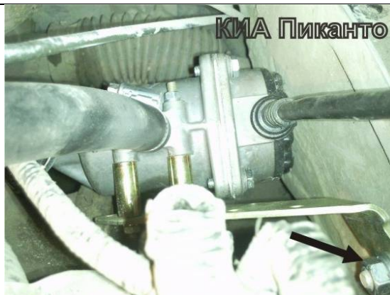
Рисунок 2. Установка подогревателя на а/м.