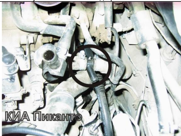
Рисунок 4. Врезка тройника выходного рукава.