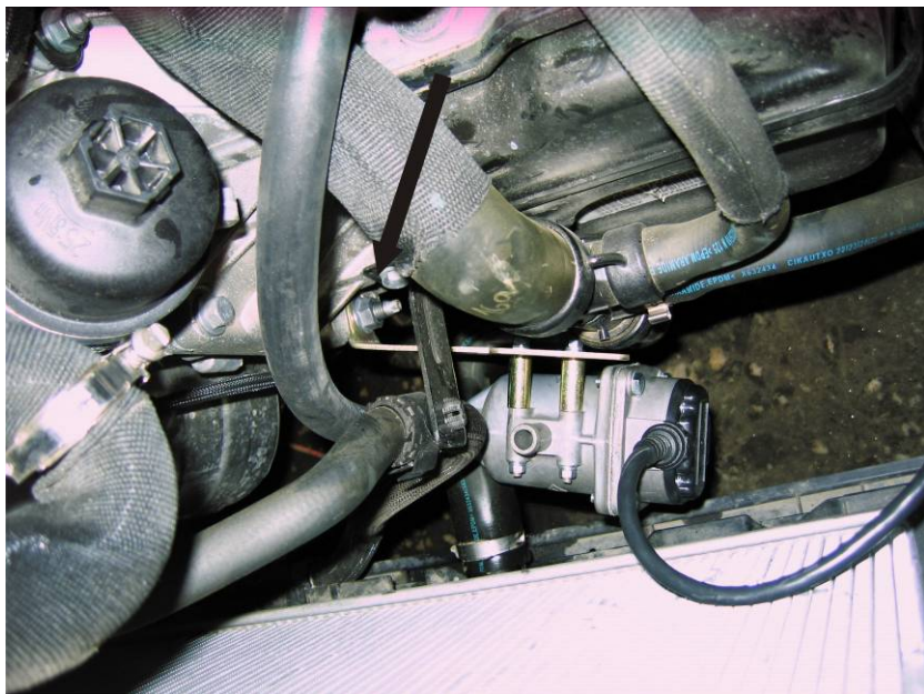
Рисунок 2. Установка подогревателя (Вид с верху).