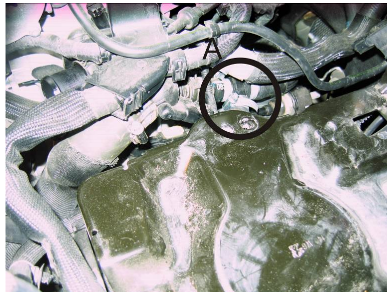
Рисунок 3. Врезка тройник входного рукава