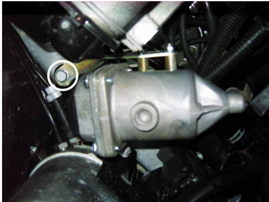
Рисунок 2. Вид снизу.