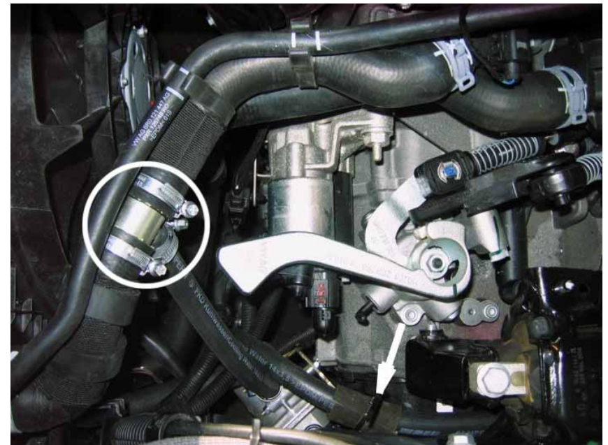
Рисунок 4. Вид сверху со стороны левого крыла.