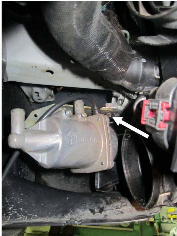
Рисунок 2. Крепление подогревателя. Вид снизу со стороны правого переднего колеса