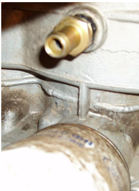
Рисунок 3. Штуцер выходного рукава.