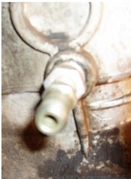
Рисунок 2. Штуцер входного рукава.