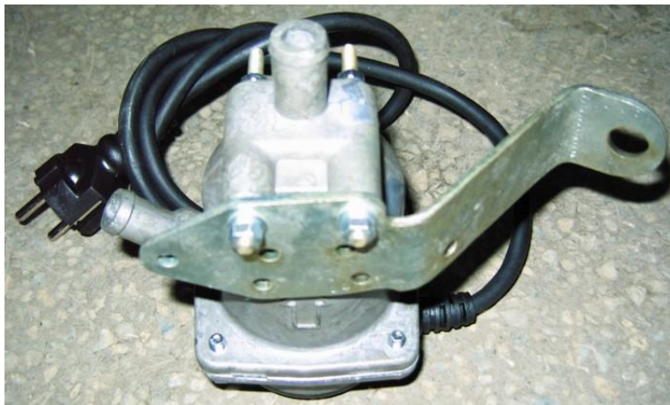
Рисунок 1. Крепление подогревателя на кронштейне.