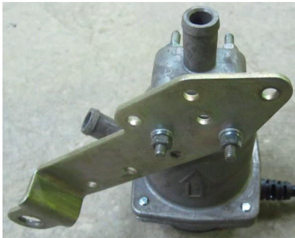
Рисунок 1. Крепление кронштейна к подогревателю.