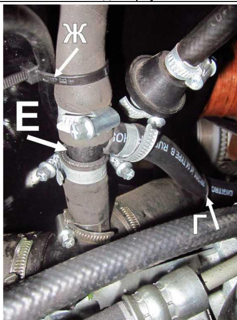
Рисунок 4. Врезка тройника входного рукава. Фиксация рукава и провода. Вид сверху.