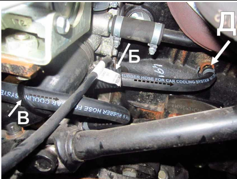
Рисунок 3. Врезка штуцера выходного рукава. Защита и фиксация рукавов. Вид сверху.