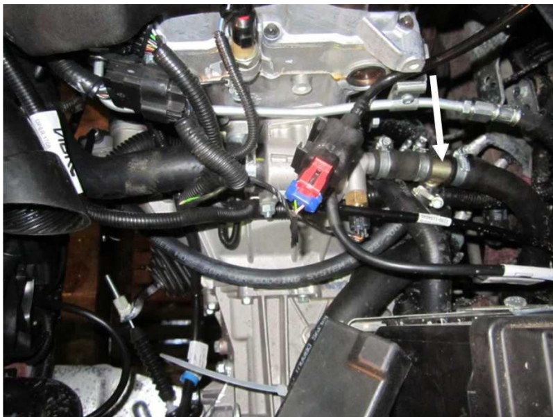
Рис. 4. Лада Гранта. Врезка тройника выходного рукава в шланг отопителя салона.