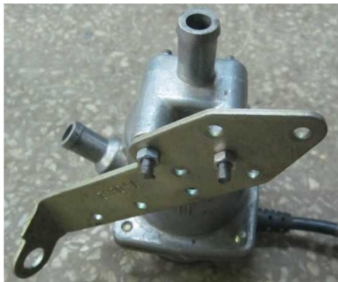
Рис. 1. Крепление кронштейна.