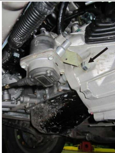
Рис. 2. Установка подогревателя. (Вид снизу).