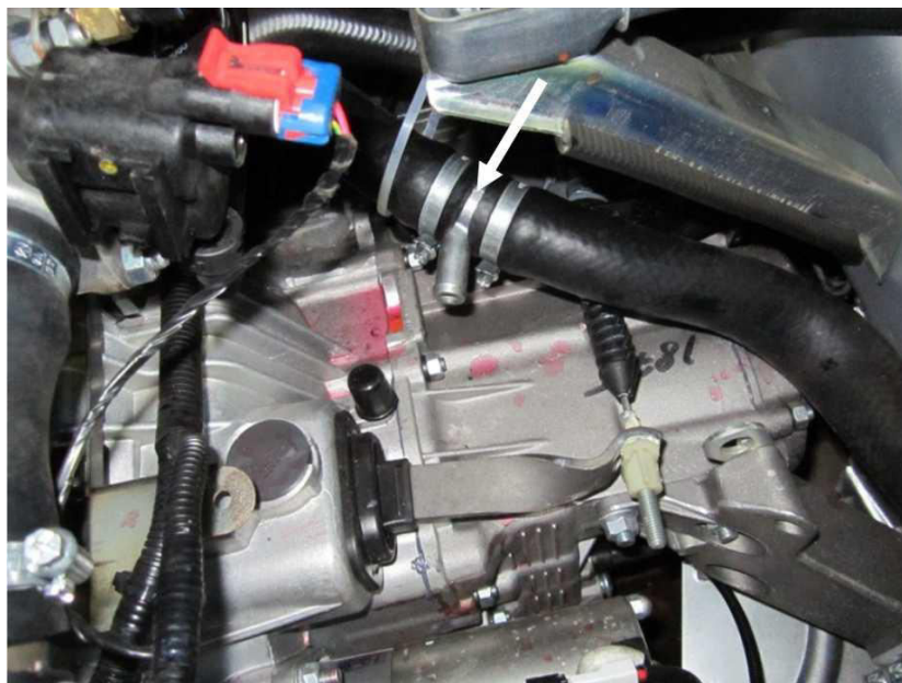
Рис. 5. Лада Гранта. Врезка тройника входного рукава в нижний шланг радиатора.